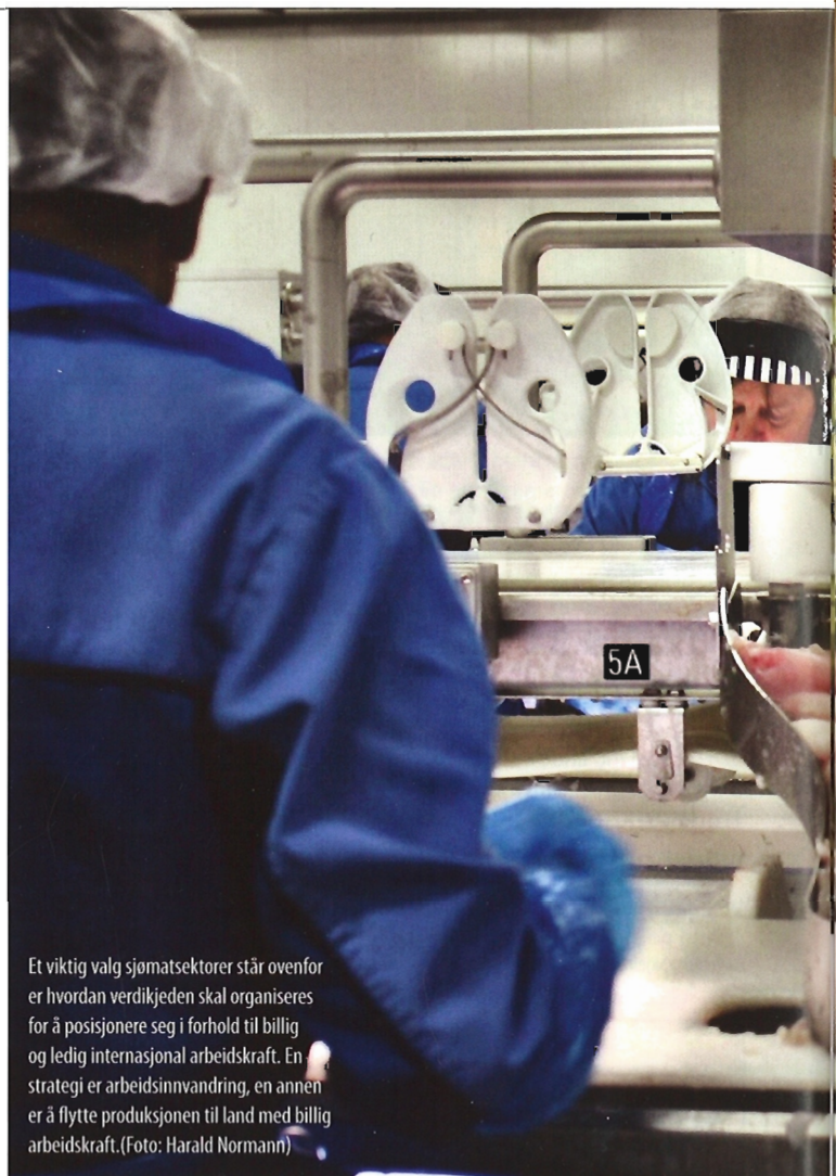
Et viktig valg sjømatsektorer står ovenfor er hvordan verdikjeden skal organiseres for å posisjonere seg i forhold til billig og ledig internasjonal arbeidskraft. En strategi er arbeidsinnvandring, en annen er å flytte produksjonen til land med billig arbeidskraft.

Utviklingen er drevet frem av økonomiske forhold. Norge er et land med høye lønnskostnader og lav arbeidsledighet. Norsk sjømatsektor produserer så store mengder fisk at over 90 prosent må eksporteres til et toft internasjonalt matvaremarked. I en slik situasjon må sektoren jakte på muligheter for å kompensere for høye lønns-