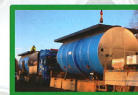
Olje- og gassfyrte kjeler fra 600 kW til 33 mW